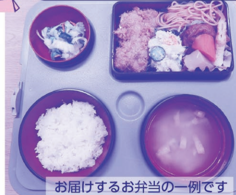
お届けするお弁当の一例です

車いすなどを利用されている方をご自宅から、町内の医療機関への送迎を行っています。(町委託事業)