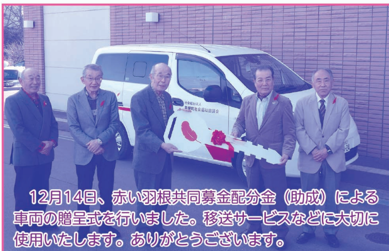
12月14日、赤い羽根共同募金配分金（助成）による車両の贈呈式を行いました。移送サービスなどに大切に使用いたします。ありがとうございます。