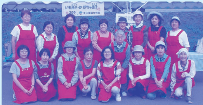
ふれあい広場びほろ