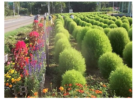
美幌のまちを 花で華やかに彩りませんか？

美幌町フラワーマスター連絡協議会では、町民の方や観光客のみなさんに楽しんでもらえるよう、町内の花壇に花を植える活動をしています。