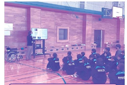
出前授業(しゃきょうデリバリー講座)