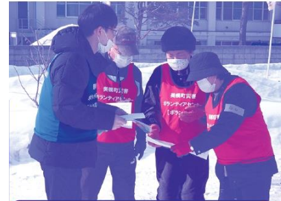
災害VC立ち上げ機能訓練

令和4年度の 美幌町社協の決算は 収入 72,725,698円 支出 68,297,534円 となりました。