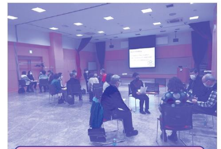
ささえ手フォローアップ研修