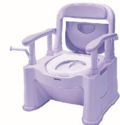
ポータブルトイレ