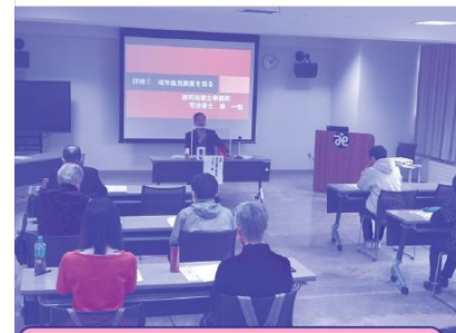
後見支援員養成講座