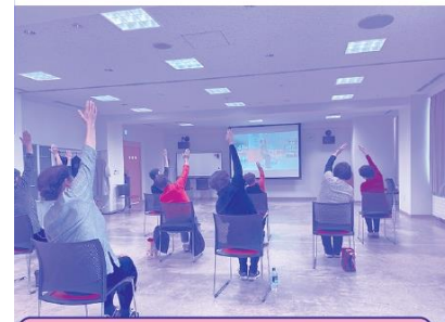
上川町とコラボ・オンラインヨガ